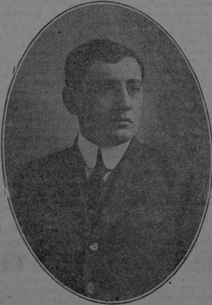
EXCMO. SEÑOR ARTURO ALESSANDRI

Durante la Presidencia de don Pedro Montt. fue nombrado Ministro de Hacienda. En 1915, después de una ruda campaña electoral, fue nombrado Senador